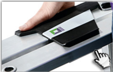
ergo-pad® Griffzone ergonomischer Tragekomfort