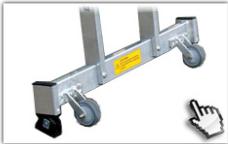
Roll-bar - Traverse Rücken schonender Ortswechsel