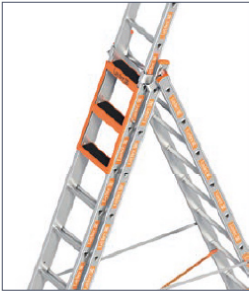
Einhängetritt bei einer Schiebeleiter TOPIC 1040