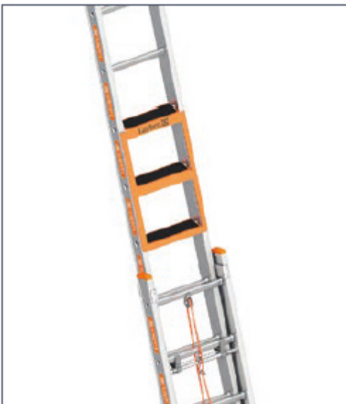
Einhängetritt bei einer Schiebeleiter TOPIC 1037