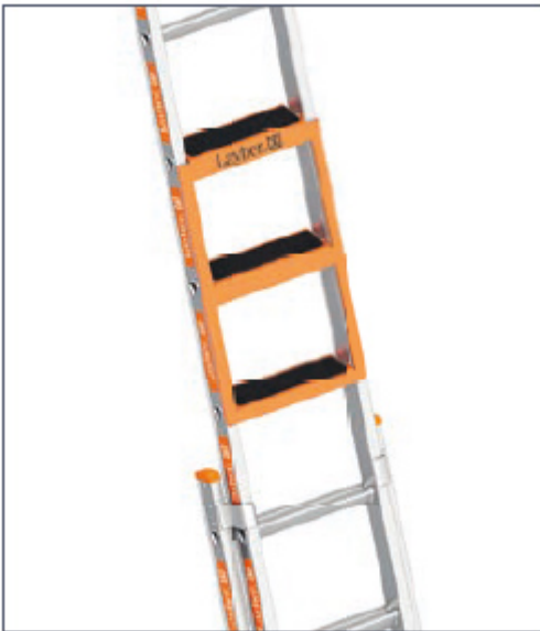
Einhängetritt bei einer Schiebeleiter TOPIC 1035

Stufeneinhängetritt aus qualitativ hochwertigem Stahl, mit einem Eigengewicht von ca. 3 kg. Pulverbeschichtet mit einer Materialstärke von 2,5 mm. Der Stufeneinhängetritt rüstet gleich 3 Stufen auf einmal nach.