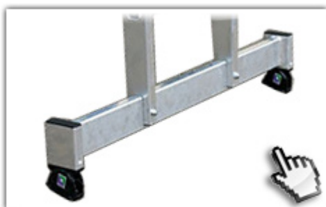
nivello® - Traverse extra hohe Standsicherheit