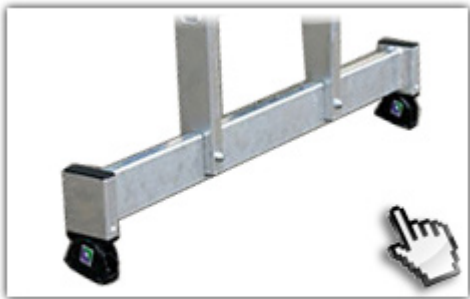
nivello® - Traverse extra hohe Standsicherheit

2-teilige Mehrzweckleiter mit 0,85m bzw. 1,10m breiter Nivello-Traverse und beidseitig rutsicheren nivello-Leiterschuh für extra sicheren Stand und hohe Arbeitssicherheit.