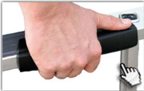
ergo-pad® Griffzone ergonomischer Tragekomfort