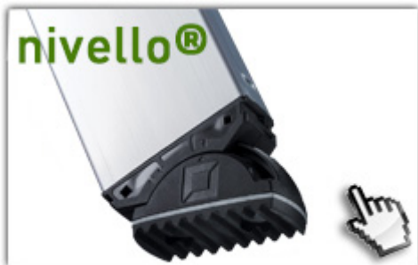
nivello® - Leiterschuhe 4-fach größere Auflagefläche