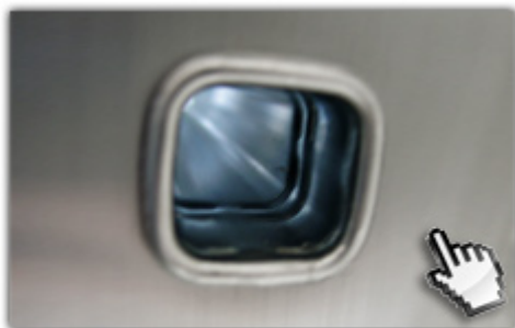
4-fach gebördelte Sprossen-Holmverbindungen