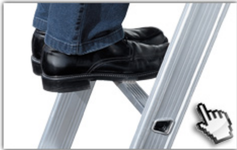
32mm tiefe, gewinkelte Trapezsprossen